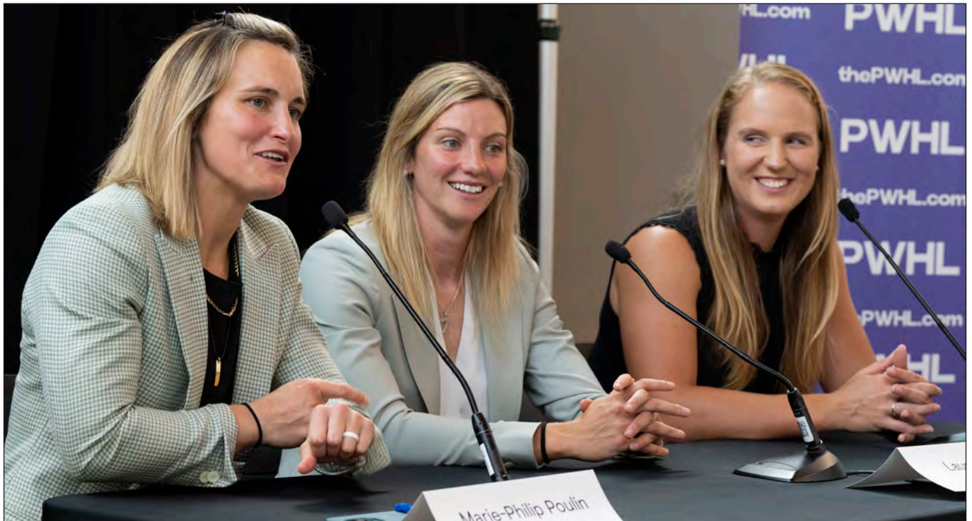
La Ligue professionnelle de hockey féminin présente les joueuses de hockey canadiennes Marie-Philip Poulin, à gauche, Laura Stacey, au centre, et Ann-Renée Desbiens comme étant les trois premières joueuses à avoir signé des contrats d'agent libre avec la franchise montréalaise de la ligue, à Montréal, le 7 septembre 2023.